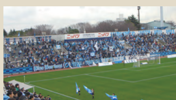
ニッパツ三ツ沢球技場の 夜間照明も当社製品