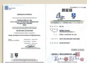
各種認証を取得、品質(ISO9001) 環境(ISO14001)